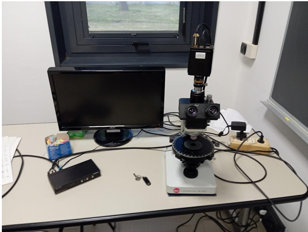
Fig.1 - Postazione

La postazione (Fig.1) è formata da un microscopio Leitz Laborlux 12 pol, una telecamera OPTECH, uno switch TVONE e un monitor (opzionale il suo utilizzo)