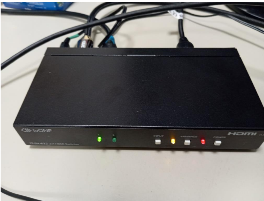
Fig. 4 - Switch