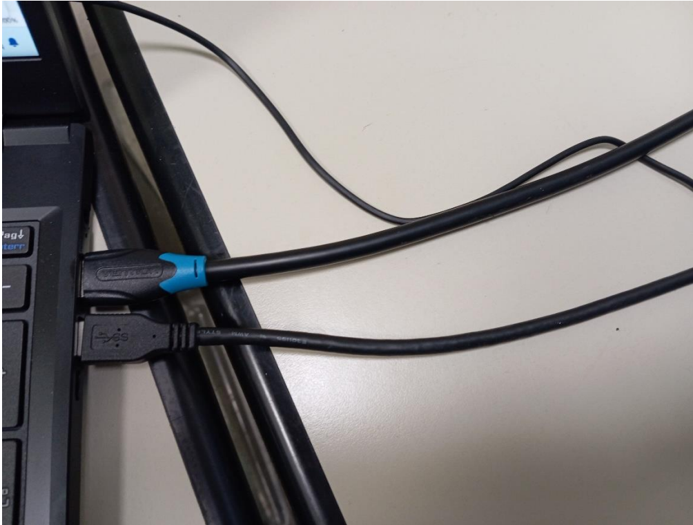
Fig. 3 – Cablaggi portatile